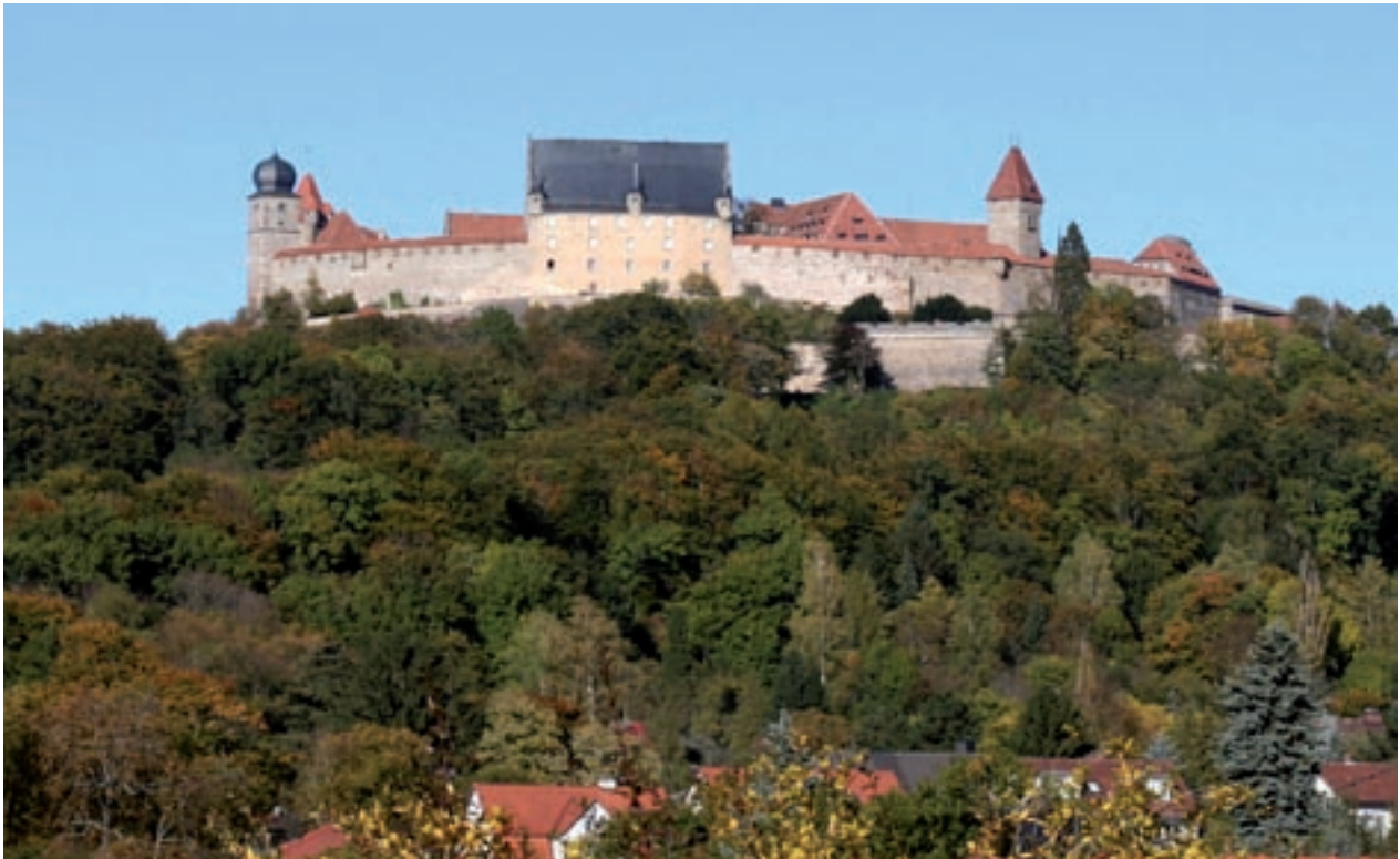
Veste Coburg