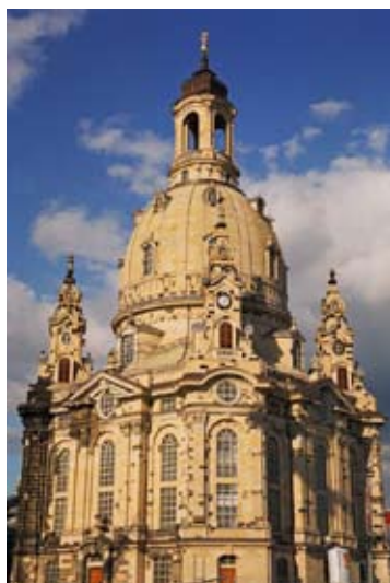
d) Frauenkirche in Dresden