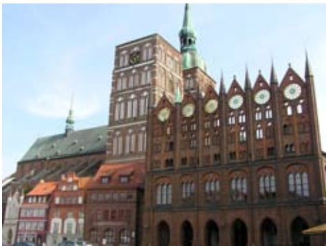
a) Rathaus und Nikolaikirche in Stralsund