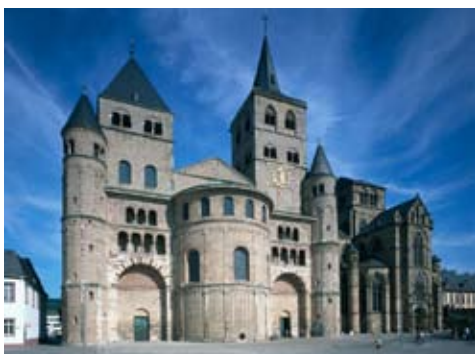
b) Liebfrauenkirche in Trier