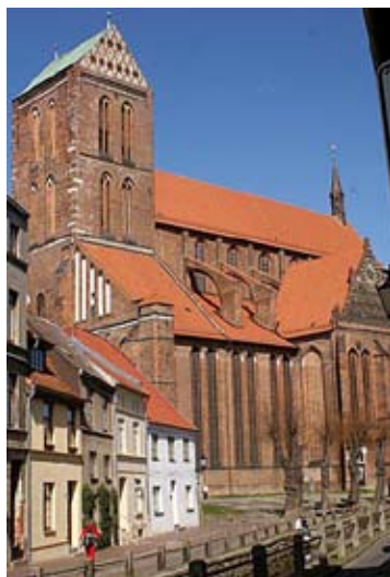
c) St.-Nikolai-Kirche in Wismar