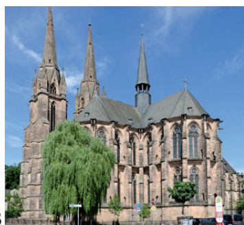
B 3. Köln