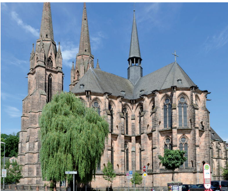
Abbildungen: Stiftskirche Gernrode, Elisabethkirche Marburg