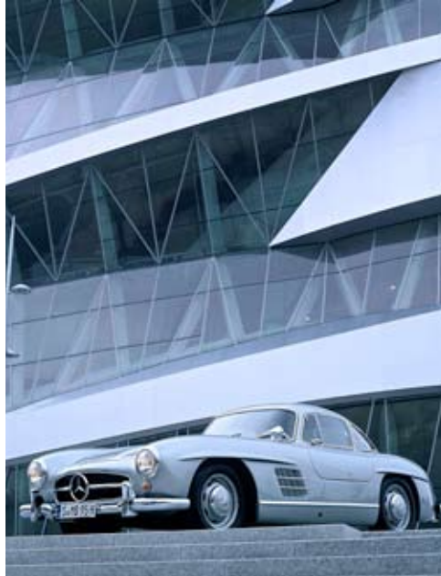
Mercedes-Benz-Museum Stuttgart