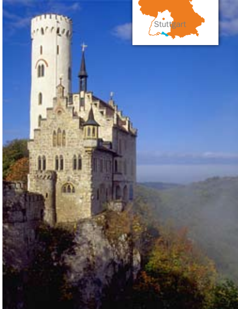
Schloss Lichtenstein