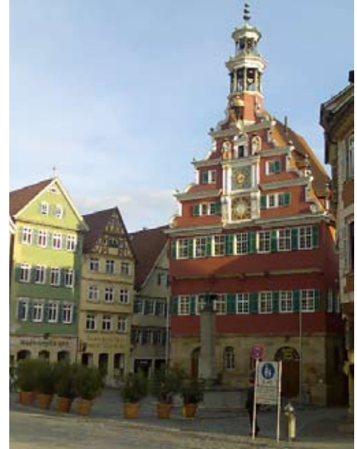
Esslingen - Rathausplatz